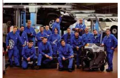
Die Mitarbeiter der Werkstatt des Volkswagen Zentrum Duisburg

auf Fahrzeugauswahl, Flottengröße oder Finanzierungsmöglichkeiten haben. Ein beliebter Service für Firmenkunden ist unser Wochenend-Service-Angebot – Sie geben uns freitags am Nachmittag Ihr Firmenfahrzeug und wir sorgen dafür, dass Sie es gleich Montagmorgen zurückerhalten, damit Sie und Ihre Mitarbeiter wieder durchstarten können und Ihre Kunden wie gewohnt pünktlich bedienen können. Sprechen Sie uns an! www.volkswagen-duisburg.de