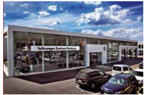
Das Volkswagen Zentrum Duisburg

Intention / Ziel des Films: Kompetenz der phone point TelekommunikationsService GmbH in der IP – Telefonie